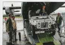
De vereniging is regelmatig te gast bij evenementen

voor. Persoonlijk kennismaken? Dat kan natuurlijk, bezoek voor meer informatie en honderden foto's de website www.nmlv.nl