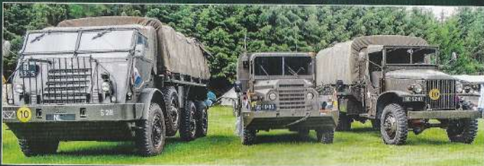
Wie heeft de garage om deze mastodonten onderdak te geven?