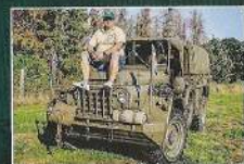
Guy Willems met zijn YA126 uit 1966

De NLVL biedt wat ze er van verwachten: een bak gezelligheid, elkaar helpen bij het sleutelen en er worden genoeg activiteiten georganiseerd, zoals natuurlijk ritten maar ook extra evenementen, zoals een rit met gehandicapten en oriëntas de activiteiten rondom de 75-jarige verjaardag van Limburg.