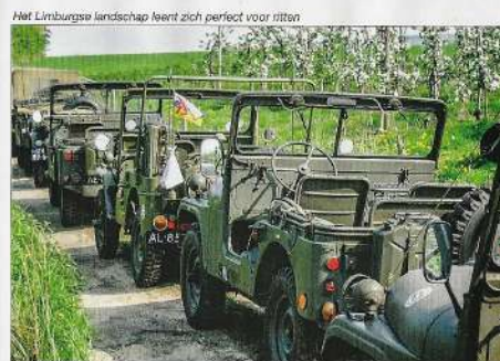
Het Limburgse landschap leent zich perfect voorritten