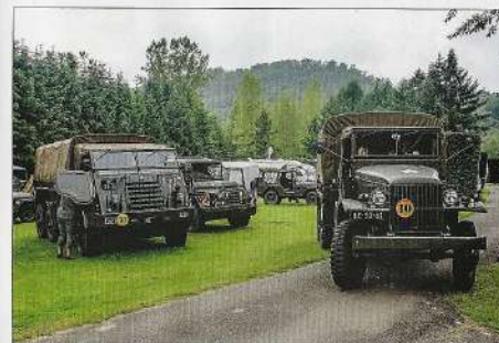
Het sociale karakter van de vereniging komt goed naar voren bij familieweekenden

woonplaats Voerendaal een aantal Tweede Wereldoorlog-II voertuigen (Dodges) aantroffen, waren ze meteen onder de indruk. Helaas bleken deze voertuigen qua aanschaf en onderhoud boven budget. Een naoorlogse DAF YA126 vormde